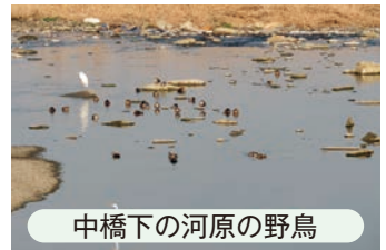
中橋下の河原の野鳥