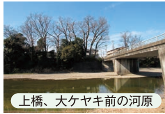
上橋、大ケヤキ前の河原

今度は下流に向かい上橋をくぐり、堤防の上に出て遊歩道を歩きます。まず目に入るのは、西武線の新旧の鉄橋です。電車の走る姿と鉄橋、季節によっては桜の花も重なって絶好の撮影ポイントです。珍しい古い車両が走るときは撮り鉄も集まるそうです。