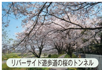
リバーサイド遊歩道の桜のトンネル