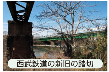
西武鉄道の新旧の踏切