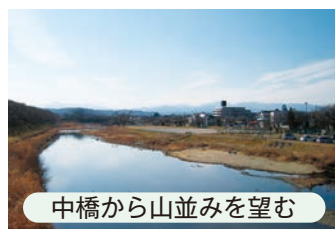
中橋から山並みを望む

ぞれの所に行く途中の路地を歩けば、民家の建物や自慢の花、庭木等の風情も楽しめます。