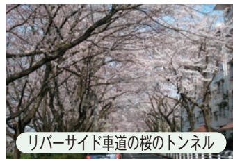
リバーサイド車道の桜のトンネル

頭上に注意しながら鉄橋の下をくぐると、リバーサイドの桜並木に出ます。桜の大木のトンネルが300m続きます。桜の季節はほんとうに見事です。青葉もよし、紅葉もよし、葉の落ちたあともまたよしと季節を問わず楽しめます。