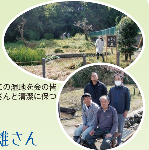
この湿地を会の皆さんと清潔に保つ