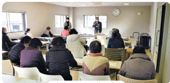
新サークル説明会