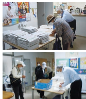
センターにて配付資料の受取り