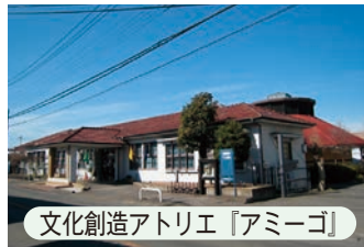
文化創造アトリエ『アミーゴ』