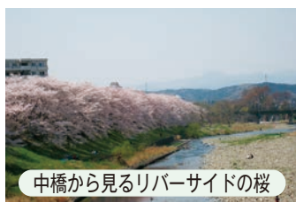
中橋から見るリバーサイドの桜

付近には、矢田の泉、白髭神社、円照寺、高正寺、八坂神社などの名勝や、図書館西武分館、ぶし駅などもあり、それ