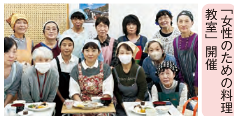
「女性のための料理教室」開催