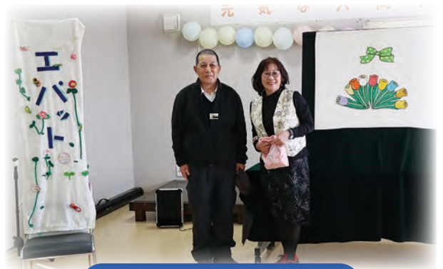
チーム・エパット