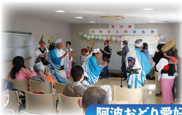
阿波おどり愛好会