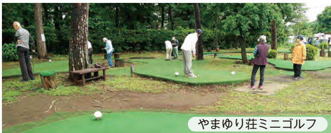
やまゆり荘ミニゴルフ