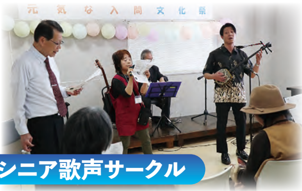
シニア歌声サークル