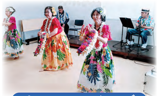
オーシャンハワイアンズ